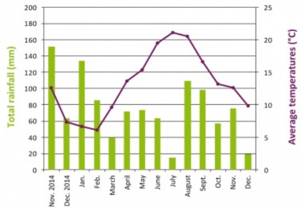
Pluviométrie et températures en 2015