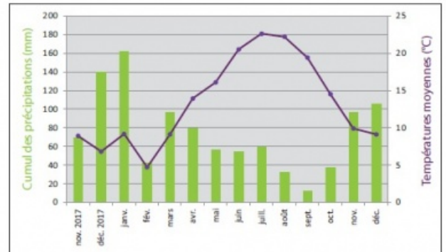
Comparatif des températures et précipitations sur la période végétative : du 1er mars au 31 octobre